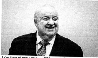
Rafael Greca foi eleito prefeito em 2020 concorrendo pelo antigo DEM

O prefeito de Curitiba, Rafael Greca (União Brasil), vai se filiar, neste sábado, ao Partido Social Democrático (PSD). Ele aceitou o convite de Gilberto Kassab, presidente nacional da legenda, e do governador Carlos Massa Ratinho Junior, presidente estadual do partido, que estarão presentes à cerimônia.