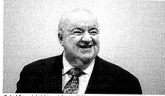
Rafael Greca foi eleito prefeito em 2020 concorrendo pelo antigo DEM

O prefeito de Curitiba, Rafael Greca (União Brasil), vai se filiar, neste sábado, ao Partido Social Democrático (PSD). Ele aceitou o convite de Gilberto Kassab, presidente nacional da legenda, e do governador Carlos Massa Ratinho Junior, presidente estadual do partido, que estarão presentes à cerimônia.