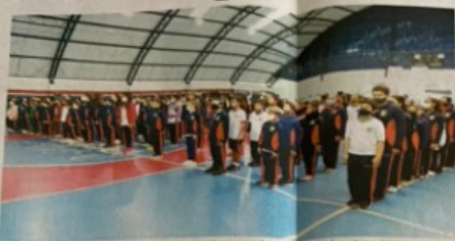
Alunos das escolas municipais de Apucarana participaram do evento no Complexo Esportivo Aurore Calente.

Com a participação de 400 alunos das escolas municipais de Apucarana, foi realizada no sábado (11), no Complexo Esportivo Aurore Calente, a 4ª edição do Festival do Dragão de King Fu, evento que teve o apoio da Secretaria Municipal de Esportes e do Conselho Municipal de Esportes, a organização da Escola Chen Tai Chi Apucarana e a supervisão da Associação Shizuoka e da Federação Paranaense de King Fu Wushu. Também competiram no festival, atletas das oficinas esportivas de kung fu oferecidas pela Secretaria Municipal de Esportes e alunos dos colégios estaduais Alberto Santos Dumont, Polivalente e Nilo Cairo. Todos os competidores receberam medalhas.