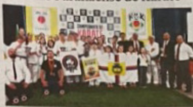
Equipe apucaranaense foi representada por 26 atletas.

A Associação Kime Shotokan, de Apucarana, foi campeã no último sábado (18) do Campeonato Paranaense de Karatê, disputado no Centro de Eventos Armando Trindade Fonseca, em Paranavaí (Noroeste do Estado). A competição foi realizada com a presença de mais de 200 atletas de 13 associações do Estado. A Associação Nikkey, de Curitiba, ficou em segundo lugar, seguida por Paranavaí, Associação Shinobukai/Faxinal e Maringá.