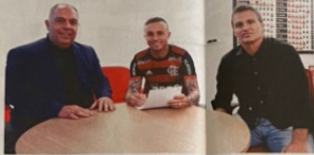
Jogador assinou contrato, mas deve começar a treinar apenas no final do mês.

No dia em que foi anunciado que o atacante Bruno Henrique só voltará a jogar em 2023 porque submetido a uma cirurgia para corrigir o rompimento de ligamentos do joelho, a diretoria do Flamengo oficializou nesta segunda-feira (20) a contratação de Éverton Cebolinha. O jogador assinou contrato, mas deve começar a treinar apenas no final do mês.