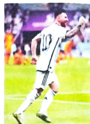
Messi comemora classificação da Argentina contra a Holanda

meçou movimentada. Os argentinos seguraram a bola no ataque. Messi e De Paul avançaram. Após falta de Dumfries em Acuña, arbitragem marca pênalti. Messi cobra com tranquilidade e faz o 2 a 0 aos 27 minutos.