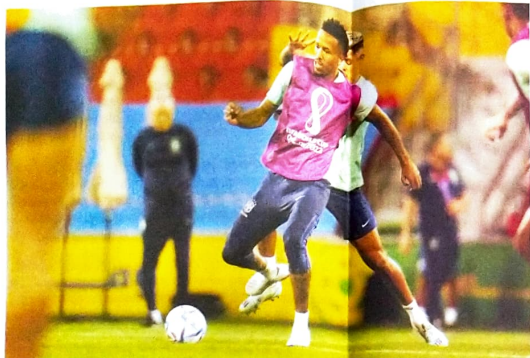
Militão deve seguir no time titular jogando na lateral direita contra a Croácia.

O jogador treinou com o grupo ontem e não aparentou nenhuma restrição de movimentos. Mesmo assim, deve ficar de fora da partida que vale vaga na semifinal. "A tendência é de (Alex Sandro) não participar, porque não há ainda um trabalho muito forte. São lesões diferentes em relação ao Neymar", afirmou o técnico