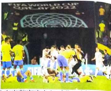
Jogadores brasileiros lamentam derrota nos pênaltis para a Croácia

Estádio Contendo cidades@tribunadonorte.com