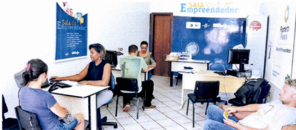
Sala do Empreendedor de Apucarana: município teve maior crescimento com aumento de 26% no número de inscrições de microempreendedores | Foto: Sérgio Rodrigo

Fonte: Associação Brasileira de Empresas de Informática