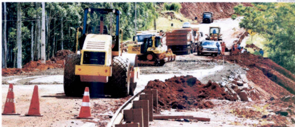
PERTO DO FIM Após mais de um mês com tráfego totalmente impedido na PR-444, obras de recuperação entram em fase final. Expectativa para liberação do trecho é grande em Araçongas, cujas ruas centrais estão recebendo fluxo intenso de caminhões pesados. Codar afirma que asfalto das ruas usadas nos desvios vão precisar de reparos