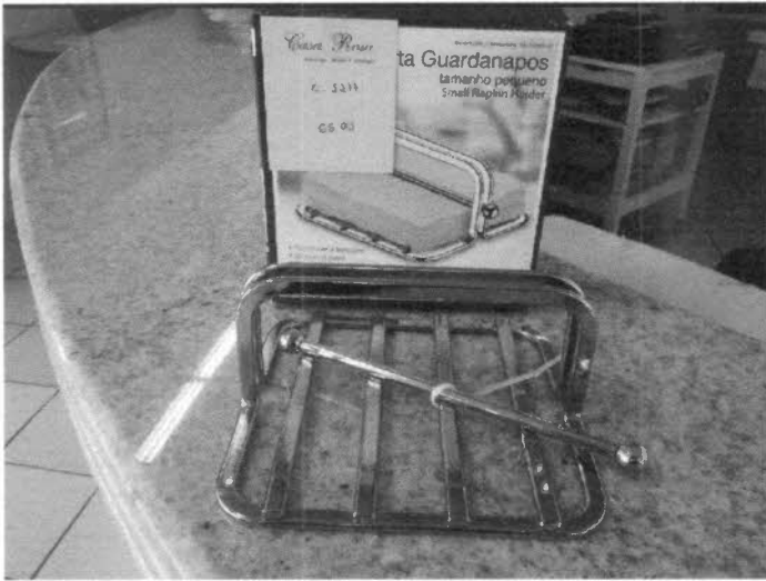
➤ 02 porta guardanapos