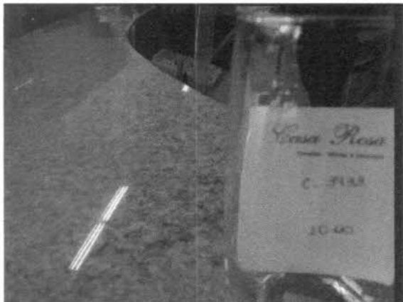
➤ 12 copos avulsos, deste modelo acima