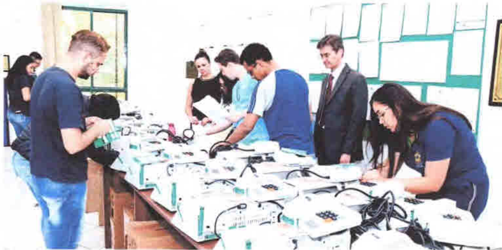
Unas foram lacradas entre terça-feira e ontem na Comarca de Apucarana

Paraná tem mais de 1,6 mil na fila do transplante